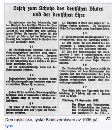
Den rasistiske, tyske Blodsvernloven av 1935 på tysk

(Oversatt fra Reichsgesetzblatt I , 1935, s. 1146-1147)